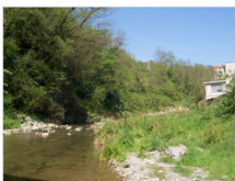
vista 9: l'alveo del torrente Verde verso i monti