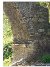
vista 6: l'imposta "lato bosco"