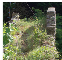
vista del camminamento