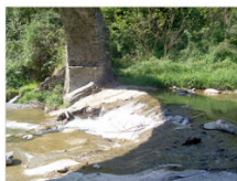
vista 3: il letto del torrente sotto il ponte