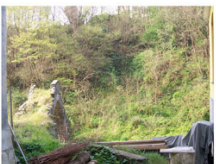
vista 2: l'accesso al ponte