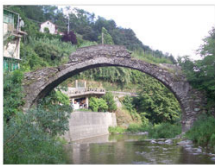
vista 8: il prospetto "lato monte"