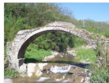
vista 4: il prospetto "lato mare"