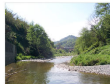
vista 5: l'alveo del torrente Verde verso il mare