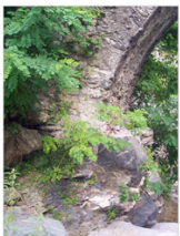
vista 1: l'imposta "lato strada"

Corso di Laurea in Restauro Architettonico